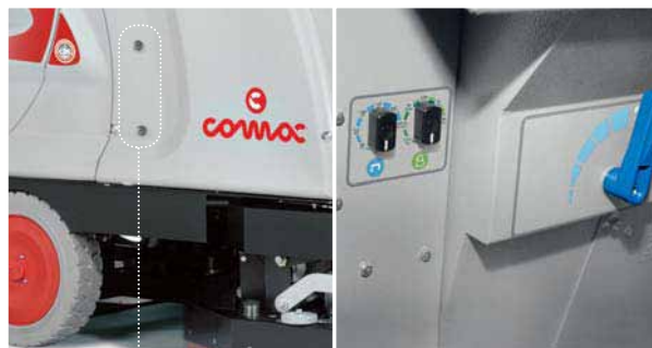
Indicadores do nível de líquido (versão com sistema CDS)

O painel é de fácil leitura e está ao alcance do operador para permitir um controle total de todas as fases de trabalho. O sistema electrónico - acessível à frente levantando o painel de controlo da máquina - permite monitorizar todas as fases de limpeza. Graças ao sistema de auto-testes, todas as anomalias podem ser identificadas para que os tempos de intervenção do serviço técnico sejam consideravelmente reduzidos.