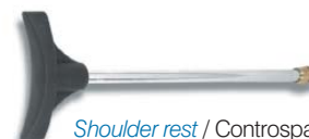
Shoulder rest / Controspalla (cod. P30506000)